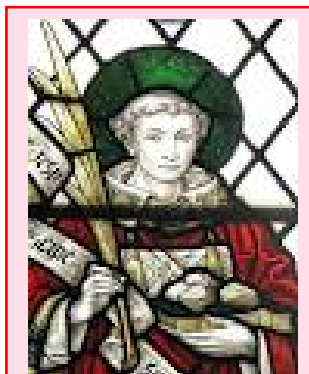
Sveti Stjepane, moli za nas!

NOVA GODINA - Sv. Bogorodica Marija, nedjelja, 1. siječnja 2012.